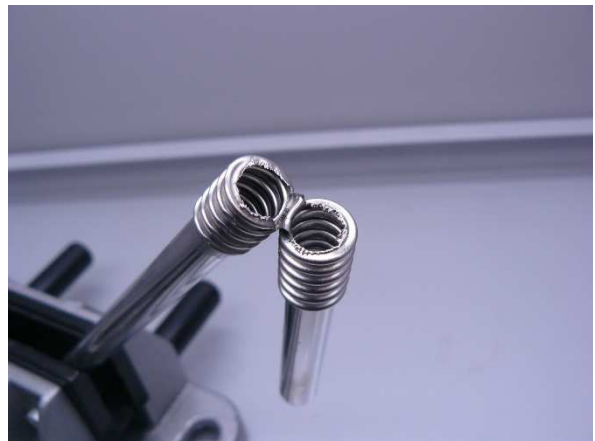
Bild / Figure 17: Mit der nassen Spülbürste 3 mal hin- und herbewegen, anschließend mit Wasser 2 Sekunden spülen / Move the wet scrub brush back and forth 3 times, then rinse with water for 2 seconds