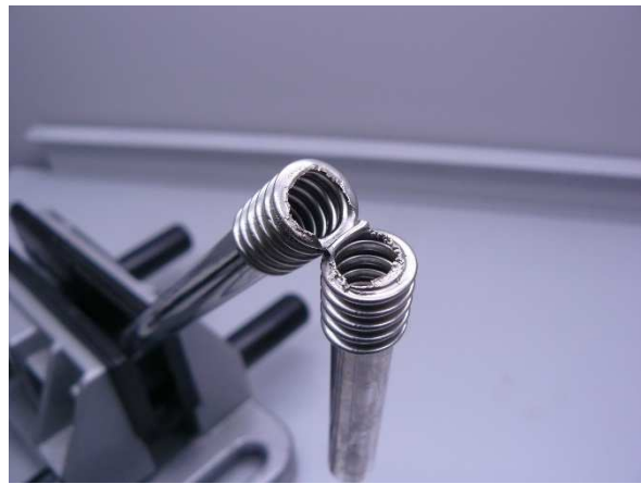
Bild / Figure 14: Mit der nassen Spülbürste 3 mal hin- und herbewegen, anschließend mit Wasser 2 Sekunden spülen / Move the wet scrub brush back and forth 3 times, then rinse with water for 2 seconds