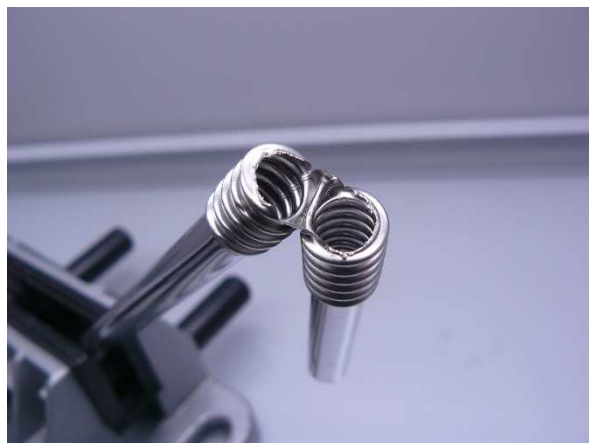
Bild / Figure 18: In der Spülmaschine reinigen bei 60 °C / Wash in the dishwasher at 60 °C