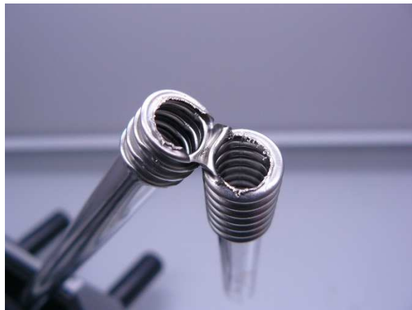
Bild / Figure 19: 2 Sekunden mit 40 °C warmen Wasser durchspülen / Rinse with 40 °C warm water for 2 seconds

Nach Einwirkzeit: 8 Stunden / after contact time: 8 hours