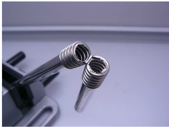
Bild / Figure 13: 2 Sekunden mit 40 °C warmen Wasser durchspülen / Rinse with 40 °C warm water for 2 seconds