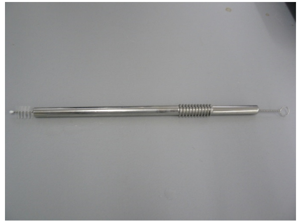
Bild / Figure 8: Mit der nassen Spülbürste 3 mal hin- und herbewegen, anschließend mit Wasser 2 Sekunden spülen / Move the wet scrub brush back and forth 3 times, then rinse with water for 2 seconds