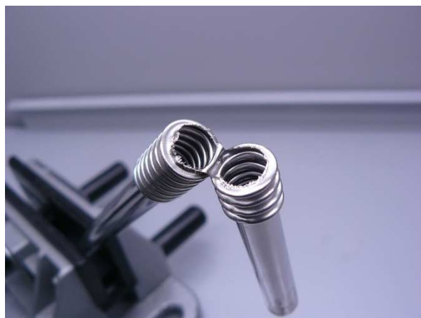
Bild / Figure 15: In der Spülmaschine reinigen bei 60 °C / Wash in the dishwasher at 60 °C