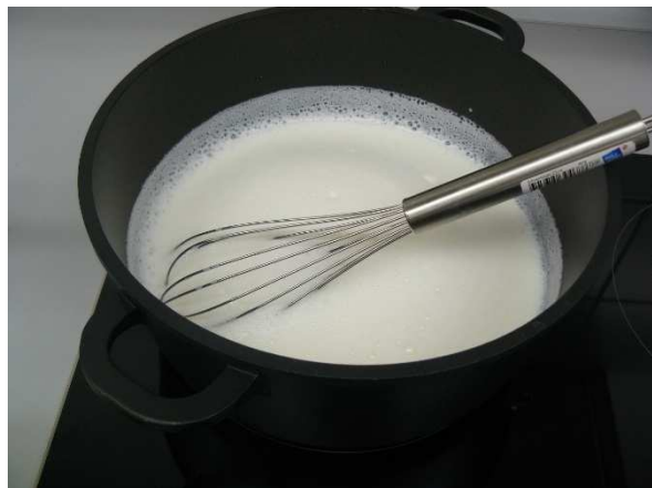
Bild / Figure 3: Edelstahl-Trinkhalme werden mit Milchschaum, 150 ml verschmutzt / Stainless steel drinking straws are soiled with milk foam, 150 ml