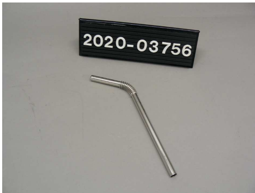
Bild / Figure 2: Edelstahl-Trinkhalme / Stainless steel drinking straws