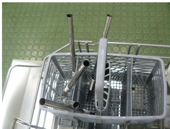
Bild / Figure 9: In der Spülmaschine reinigen bei 60 °C / Wash in the dishwasher at 60 °C