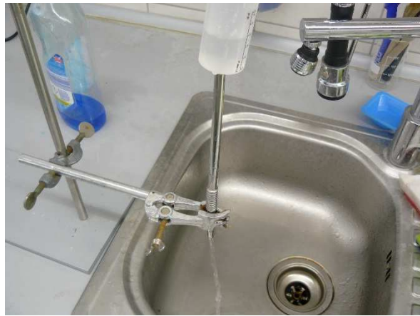
Bild / Figure 7: 2 Sekunden mit 40 °C warmen Wasser durchspülen / Rinse with 40 °C warm water for 2 seconds