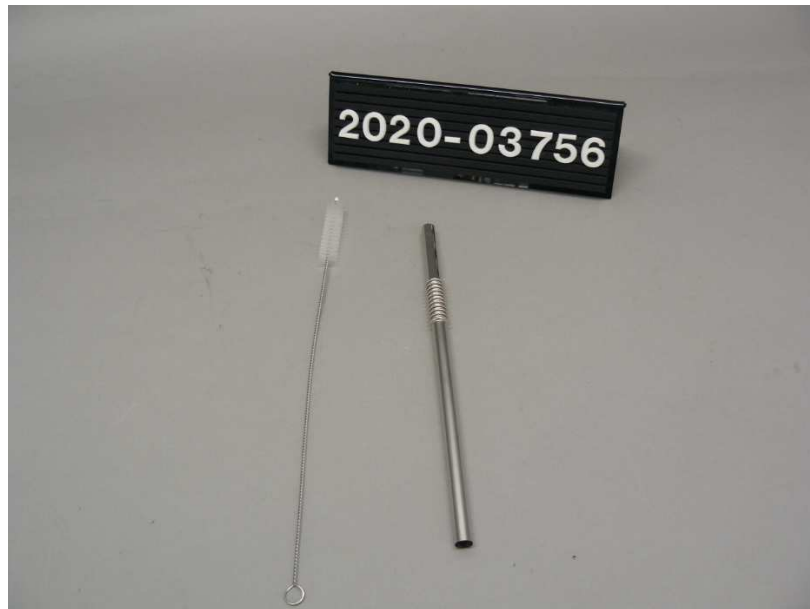
Bild / Figure 1: Edelstahl-Trinkhalme / Stainless steel drinking straws