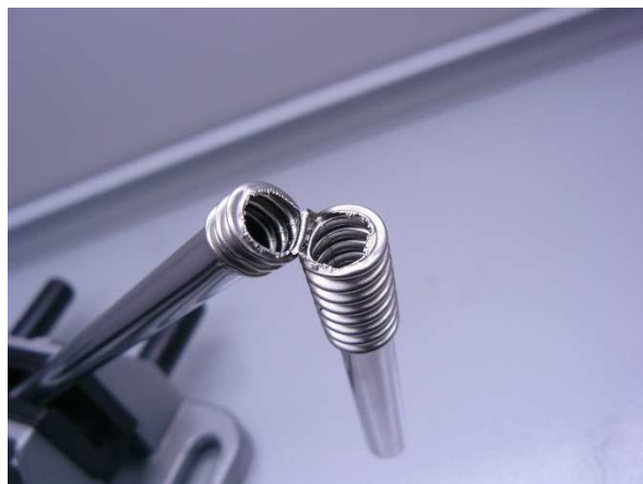
Bild / Figure 12: In der Spülmaschine reinigen bei 60 °C / Wash in the dishwasher at 60 °C