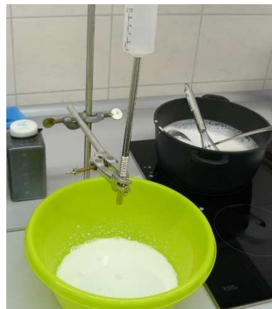
Bild / Figure 4: Edelstahl-Trinkhalme werden mit Milchschaum, 150 ml verschmutzt / Stainless steel drinking straws are soiled with milk foam, 150 ml