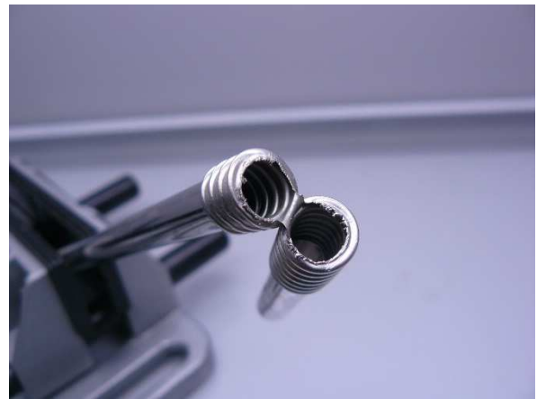
Bild / Figure 11: Mit der nassen Spülbürste 3 mal hin- und herbewegen, anschließend mit Wasser 2 Sekunden spülen / Move the wet scrub brush back and forth 3 times, then rinse with water for 2 seconds