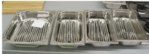
Bild / Figure 6: Edelstahl-Trinkhalme werden mit Milchschaum, 150 ml verschmutzt / Stainless steel drinking straws are soiled with milk foam, 150 ml