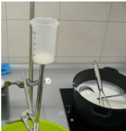
Bild / Figure 5: Edelstahl-Trinkhalme werden mit Milchschaum, 150 ml verschmutzt / Stainless steel drinking straws are soiled with milk foam, 150 ml